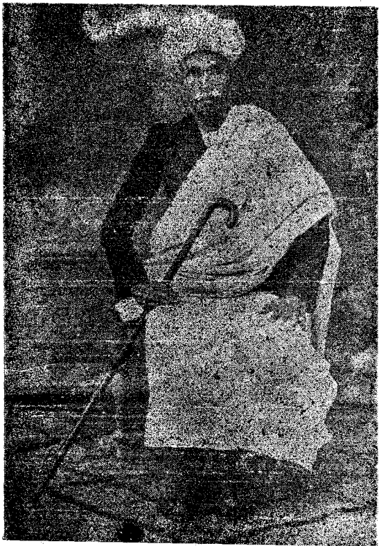
N. N. பொக்கமரதா கவுடர், நடுஹட்டி, கட்டபெட்டி போஸ்ட்.