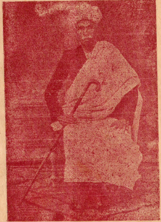
N. N. பொக்கமாதா கவுடர், நடுஹட்டி, கட்டபெட்டி போஸ்ட்.